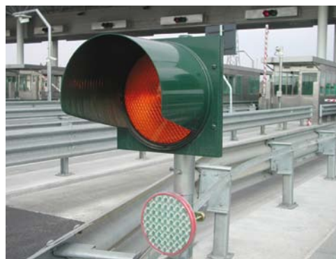
Applicazione lampeggiante su Bumper Autostradali